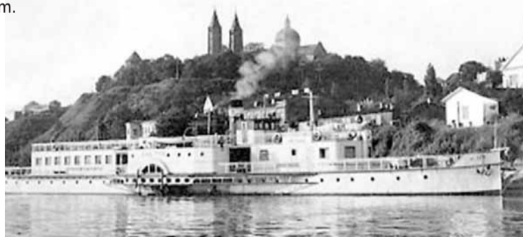
Statek pasażerski „Bałtyk” w Płocku

Po sezonie 1965 r. zdecydowano się wycofać Bałtyk z regularnej linii i przekształcić go w statek wczasowy Funduszu Wczasów Pracowniczych, gdzie również wykorzystywano go do dwutygodniowych rejsów wycieczkowych na Wiśle. Prowadzono także rejsy wczasowe na trasie War-