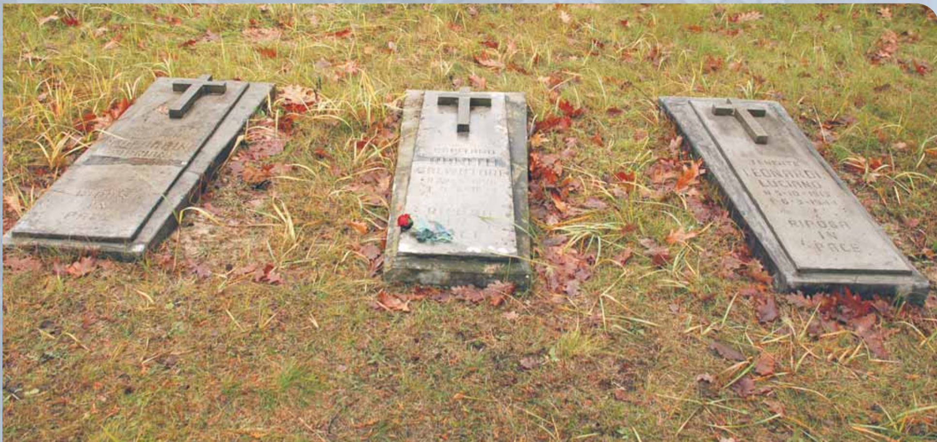
Odnowione płyty epitafijne oficerów włoskich położone na cmentarzu wojennym w Białobrzegach