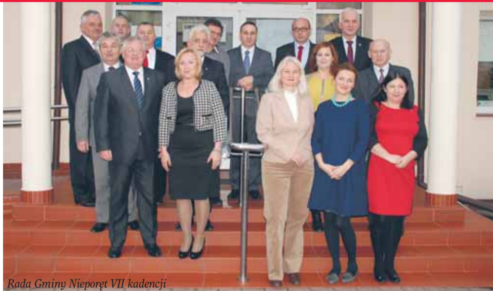
Rada Gminy Nieporęt VII kadencji